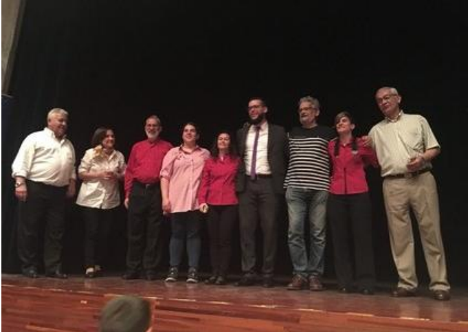
Algúnxs dxs monitorxs que fan posible que o milagre continúe.

seguidamente ás bailarinas, que mostraron as súas habilidades con ritmos quentes. E para pechar o Festival, gozouse da música coa que obsequiou a rondalla.