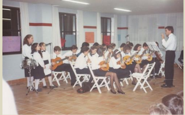
19/11/1989 A rondalla no Centro Civico do Castrillón