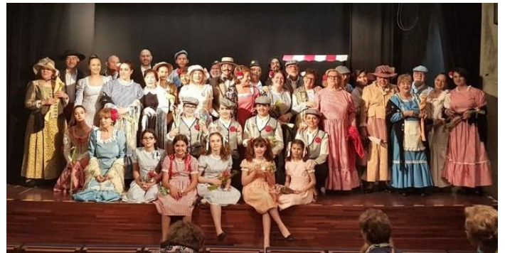
Nutrido grupo de actrices e actores participantes na zarzuela.

Tamén queremos dar as grazas a Melandrainas pola súa disposición e participación.