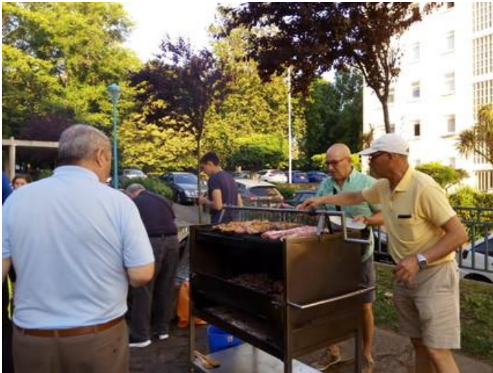
A grella e os cocifeiros non paraban.

O pasado 22 de xuño celebrouse a tradicional sardiñada de Tanxedoira. Este ano ubicouse novamente na praza anexa ao noso local, onde se deron cita diversos amigos e amigas de Tanxedoira.