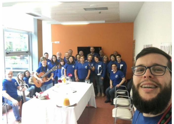
A suma de comprometidxs fixo posible os cantos.