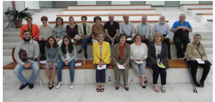
Voces limpas para corazóns brancos.

Cando chegan estas datas, sempre convidan o Coro Tanxedoira para participar nas misas que se celebran na parroquia da Resurrección do Señor, do Barrio das Flores, onde se celebran as primeiras comunións comunitarias.