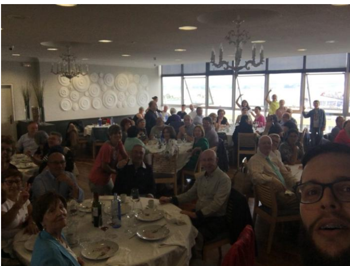
A festa, do mesmo xeito que as mesas, foi redonda.

Un nutrido grupo de socios e socias, familiares e simpatizantes tomamos asento no restaurante Boavista, na Coruña, o día 2 de xuño, para desfrutar da comida do corenta aniversario da Asociación.