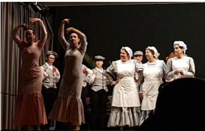
A representación da zarzuela trouxo alegría o ambiente.

Así, os membros e compoñentes do noso grupo de teatro, presentáronse no salón de actos do Centro Social da Sagrada Familia o día 17 de maio, día das Letras Galegas.